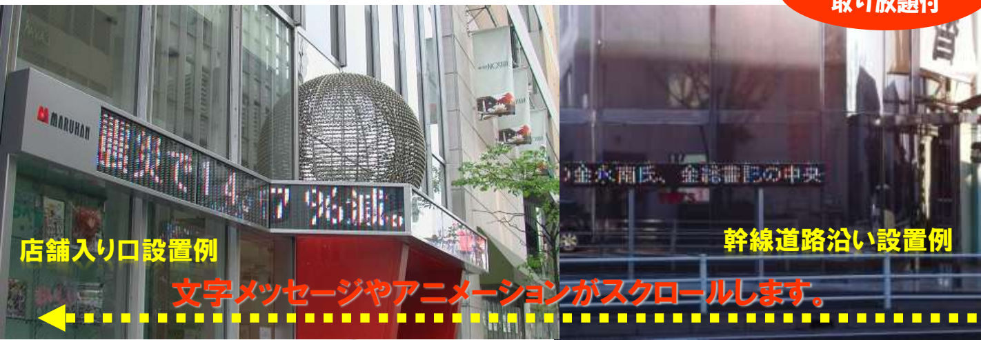
店舗入り口設置例